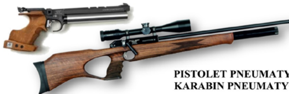
PISTOLET PNEUMATYCZNY KARABIN PNEUMATYCZNY

Ośrodek Sportu i Rekreacji w Bogatyni ogłasza nabór kandydatów do sekcji strzelectwa sportowego dla młodzieży szkolnej od lat 12 (dziewczeta i chłopcy) oraz osób dorosłych (kobiety i mężczyźni) Zapisy przyjmowane są w siedzibie OSiR przy ul. Białogórskiej 28 oraz na strzelnicy pneumatycznej przy ul. Polnej 8 w Bogatyni. Strzelnica czynna jest od poniedziałku do czwartku w godz. 16:00-20:00. Uczestnictwo w sekcji strzeleckiej jest bezpłatne!