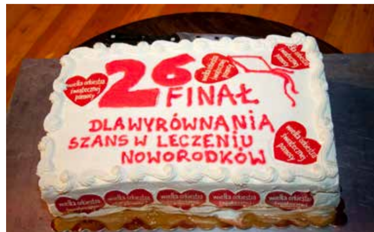
Fot. Krzysztof Kasprzyk