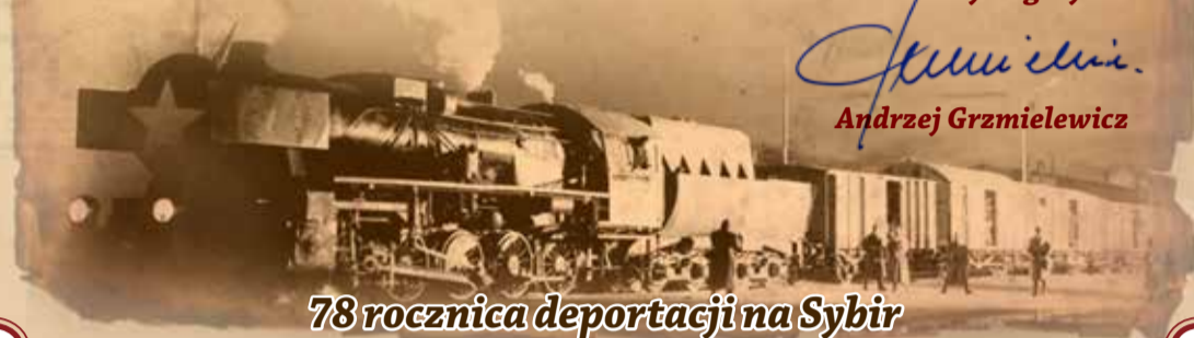
78 rocznica deportacji na Sybir

Andrzej Grzmielewicz Andrzej Grzmielewicz